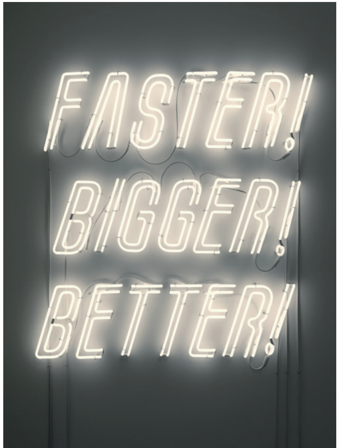
'Faster! Bigger! Better!' (2022). Kunst van Fleury is aangekocht door onder andere het Museum of Modern Art in New York.