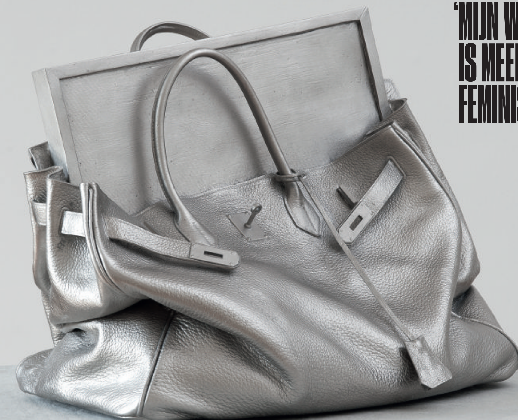
'White Gold' (2010). Fleury laat graag de overeenkomsten zien tussen kunst en consumptisme.