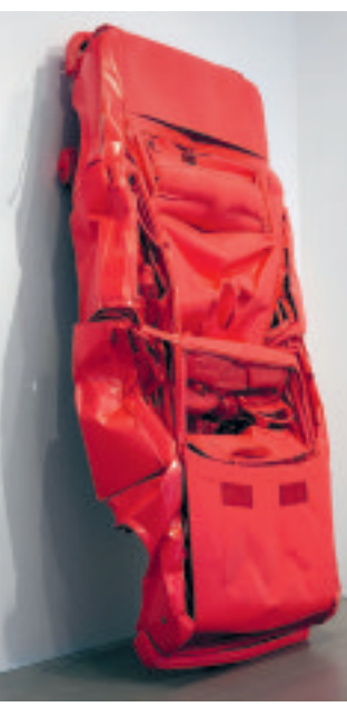
'Skin Crime 3 (Givenchy 318)' (1997). Een versie van dit werk is nu buiten de Kunsthall te zien.

en feminien is, en de verwachtingen en gedragingen die daarmee gepaard gaan. De Zwitserse vindt de invloed van mode, massamedia en marketing op menselijk gedrag razend interessant. Ze staat bekend als groot modeliefhebber, en luxeproducten uit de mode-industrie zijn veelvuldig onderwerp van haar kunst. Ze wijst zo op de overeenkomsten tussen kunst en consumptisme. De auto's zijn symbolisch voor Fleury's oeuvre: ze speelt met een object dat als uiterst masculien bekendstaat, door het te vernietigen en vervolgens een vrouwelijke touch te geven met roze verf. 'Als je naar een gedeukte auto kijkt, denk je aan iets sinisters. Maar met de felle, vrolijke lak erooveren bovendien wordt deze ochtend haar spectaculaire installatie Skin Crime 3 (Givenchy 318) voor het gebouw aan de Westzeedijk geplaatst. Het trekt veel bekijks van fietsers en automobilisten, wat ongetwijfeld de inzet is.