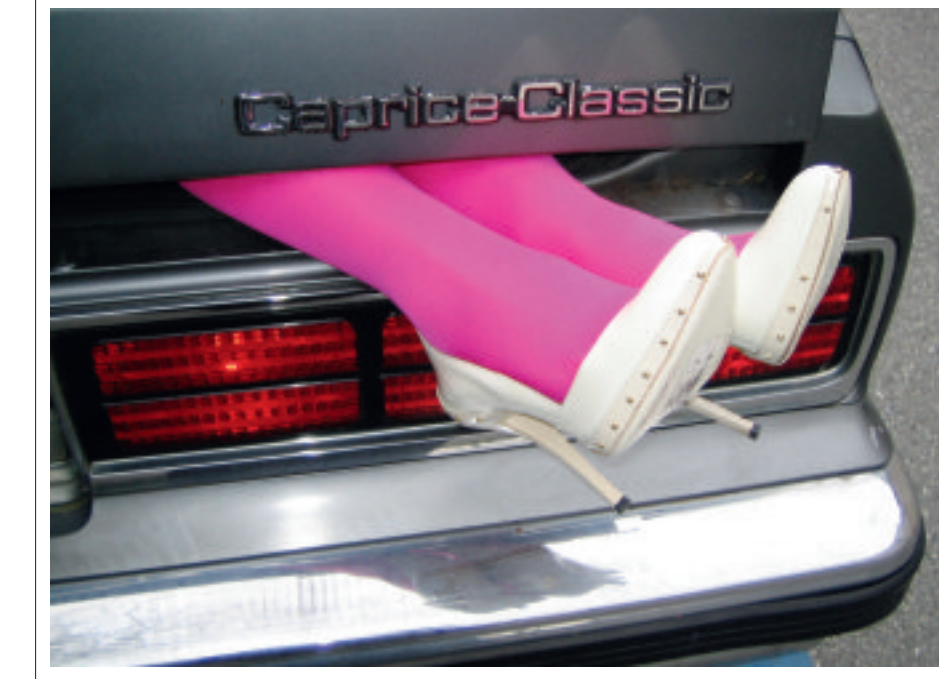
Linksboven: 'Caprice Classic' (2004). Door de vrolijke kleuren werd Fleury's werk aanvankelijk niet serieus genomen.

en feminien is, en de verwachtingen en gedragingen die daarmee gepaard gaan. De Zwitserse vindt de invloed van mode, massamedia en marketing op menselijk gedrag razend interessant. Ze staat bekend als groot modeliefhebber, en luxeproducten uit de mode-industrie zijn veelvuldig onderwerp van haar kunst. Ze wijst zo op de overeenkomsten tussen kunst en consumptisme. De auto's zijn symbolisch voor Fleury's oeuvre: ze speelt met een object dat als uiterst masculien bekendstaat, door het te vernietigen en vervolgens een vrouwelijke touch te geven met roze verf. 'Als je naar een gedeukte auto kijkt, denk je aan iets sinisters. Maar met de felle, vrolijke lak erooveren bovendien wordt deze ochtend haar spectaculaire installatie Skin Crime 3 (Givenchy 318) voor het gebouw aan de Westzeedijk geplaatst. Het trekt veel bekijks van fietsers en automobilisten, wat ongetwijfeld de inzet is.