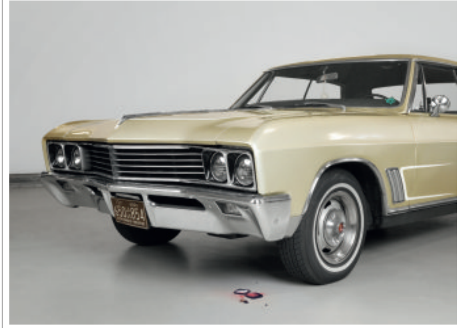
'Skylark' (1992). Auto's, masculiene objecten, pure sang, keren vaak terug in Fleury's werk.