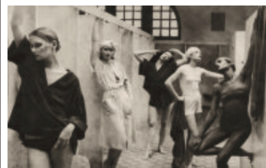
Boven en midden: beelden uit de serie 'Comme des Garçons, Passage Vivienne' (jaren tachtig).

een missie: de wereld laten kennismaken met Deborah Turbeville.