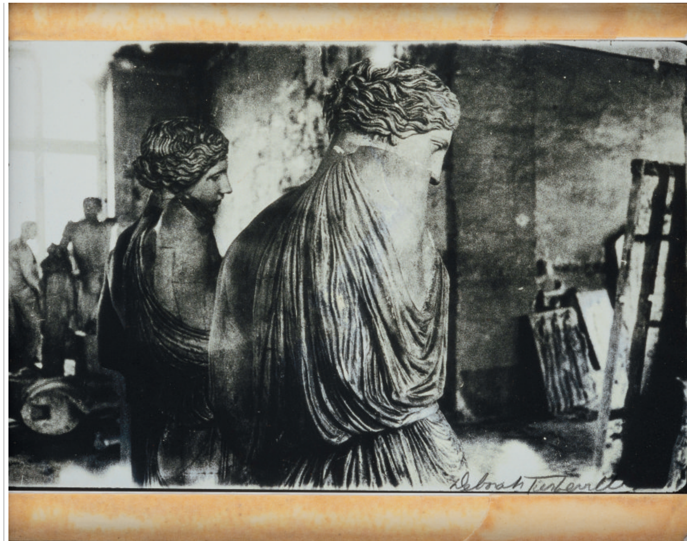
Links: beeld uit de serie 'Unseen Versailles' (1980); rechts: 'Zonder titel' (Asser Levy Bathhouse)', uit de serie 'Bathhouse' (na 1975). Alle beelden komen uit de Muus Collection.