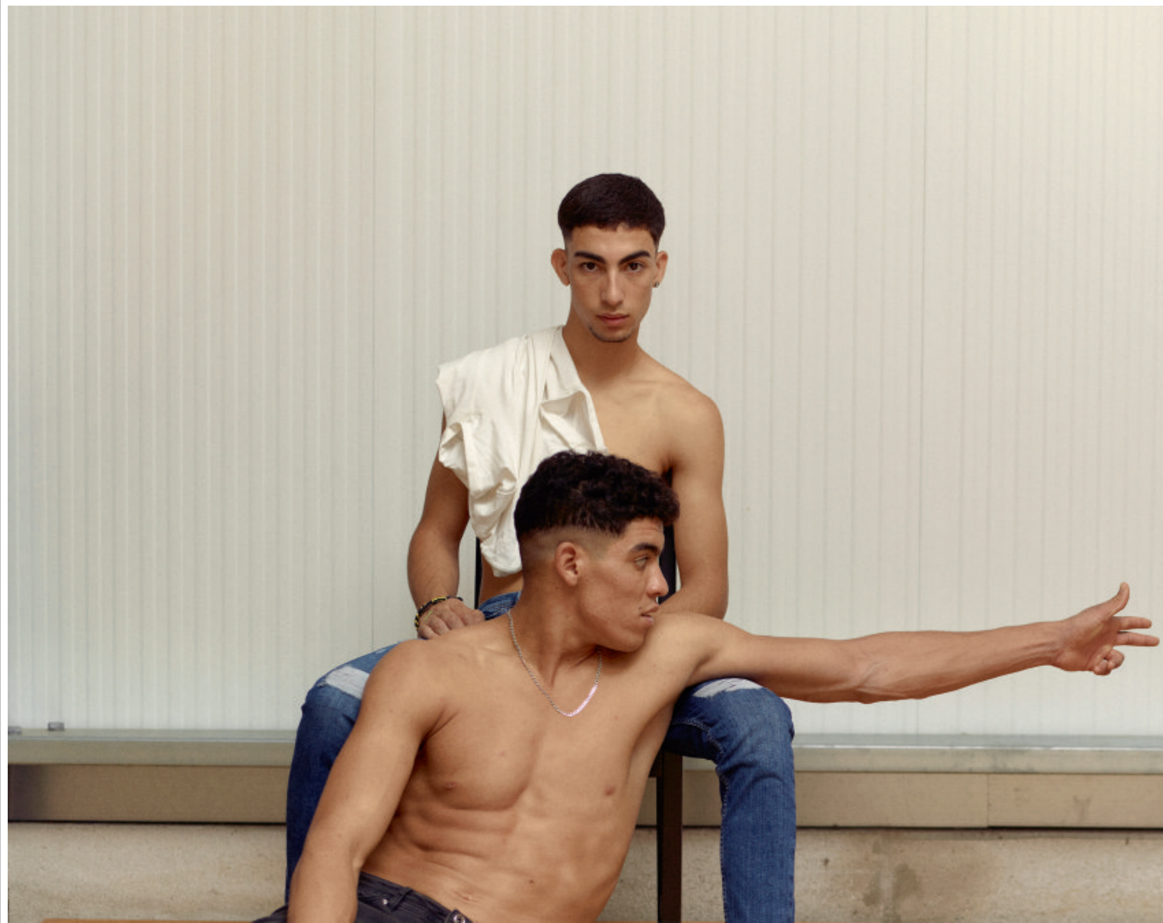
Alle beelden op deze pagina's komen uit de serie 'Dialect', die Beltrán in 2023 heeft gemaakt.