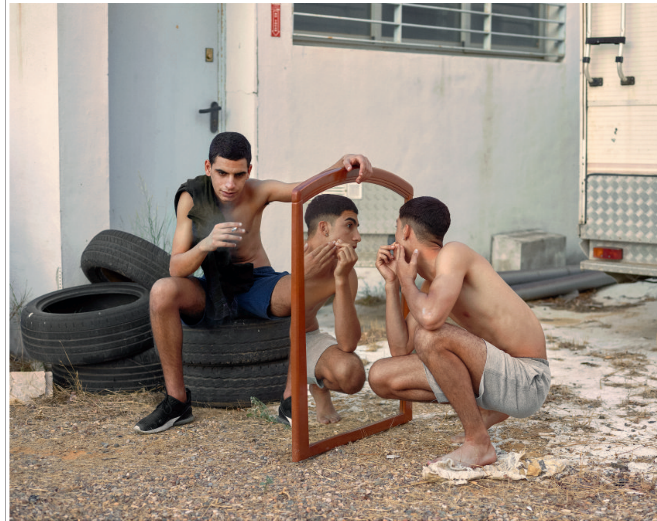
Beltrán wil met zijn foto-serie sociale ongelijkheid en uitsluiting in bedendag Spanje aan de kaak stellen.