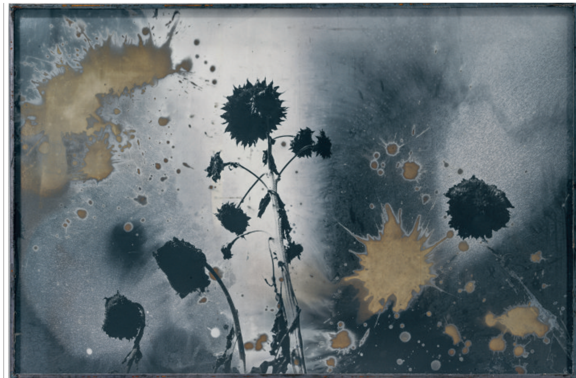
'Sonnenblumen' (1994-2012). Zonnebloemen keren regelmatig terug in Kiefers werk.