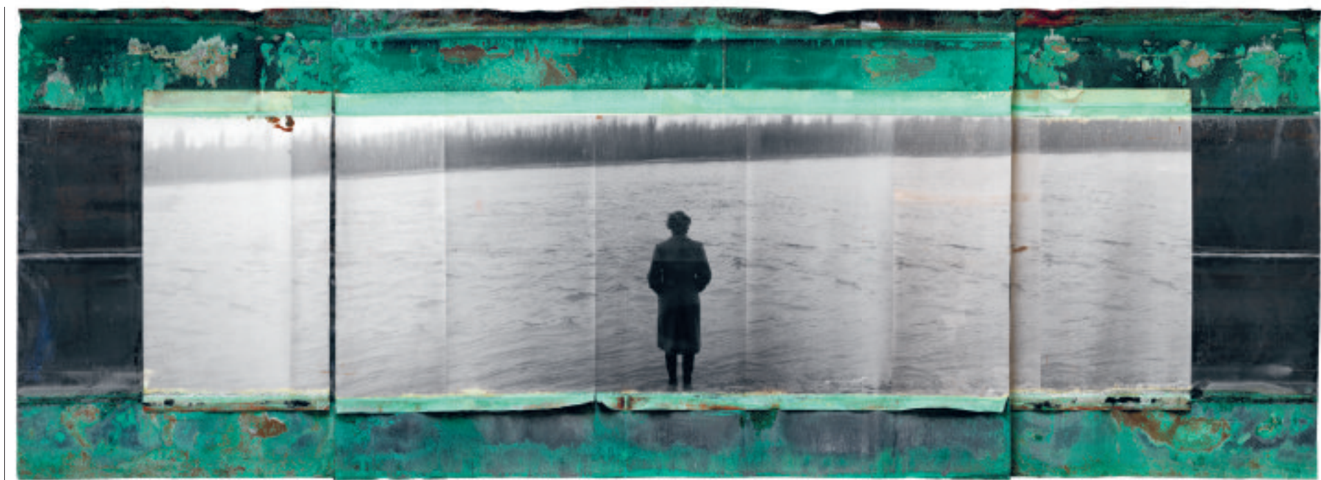
'Der Rhein' (1969-2012). De rivier speelt een belangrijke rol in het leven van Kiefer. Als kind zwom hij in de Rijn.