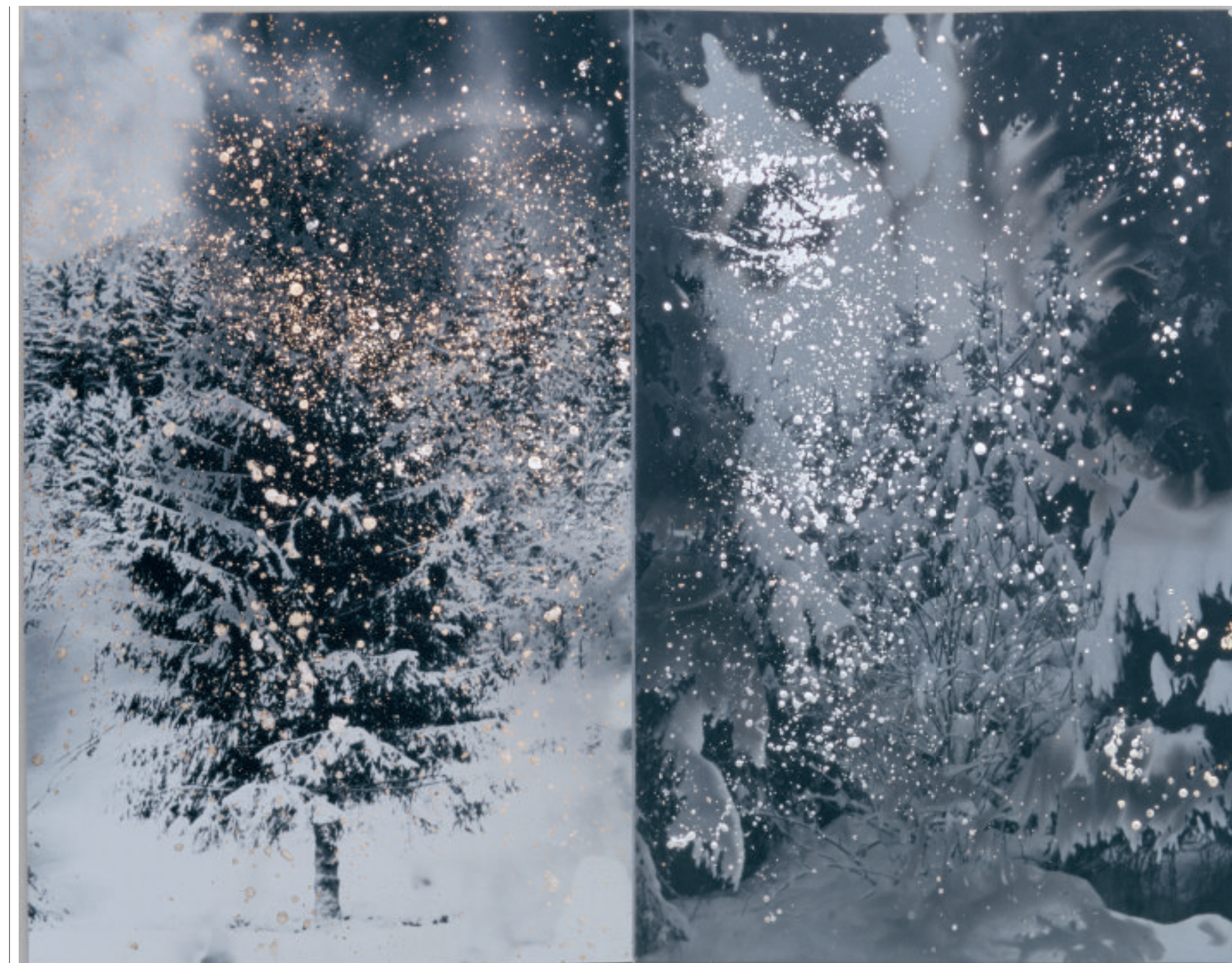
'Für Martin Heidegger Todtnauberg' (2010-2014). De Duitse filosoof is omstreden wegens zijn steun aan het naziregime.