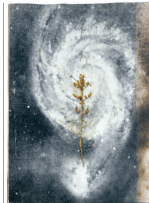
'Der gestimte Himmel über uns und das moarische Gesetz in uns' (1969-2009).

te begrijpen. Daarom deed ik deze boxen, die hij diorama's noemt, zo: 'Het zijn nissen vol open plekken in het bos, die uit elkaar voortvloeien en een uitgestrekte, lege verte schetsen. Hier en daar heb ik fasen van een Duits leven opgenomen (...)'.