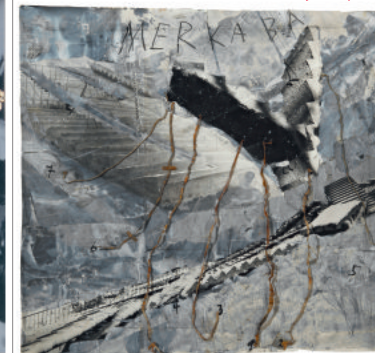
'Merka' (2005). Merka is een school van vroege joodse mystiek.