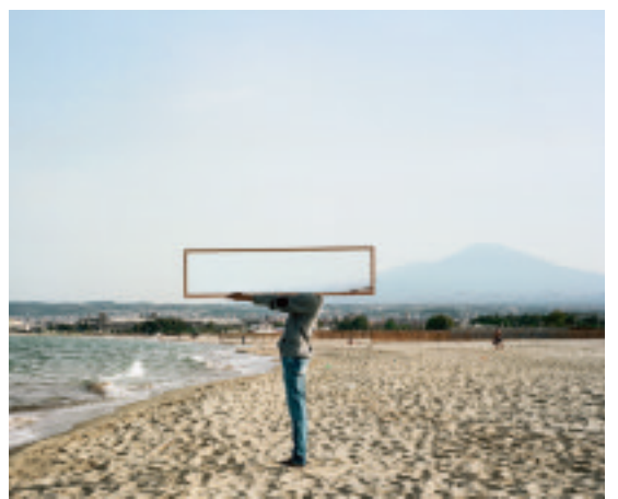
Links: 'Untitled (Epilogue III), Catania, Italy' (2016), Dawit L. Petros; midden: 'I See You From a Distance #07' (2019), Tyna Adebawale.

'Ik snap dat er door musea wordt geworsteld met de representatie van kunst door zwarte makers, juist omdat het er zo dik bovenop