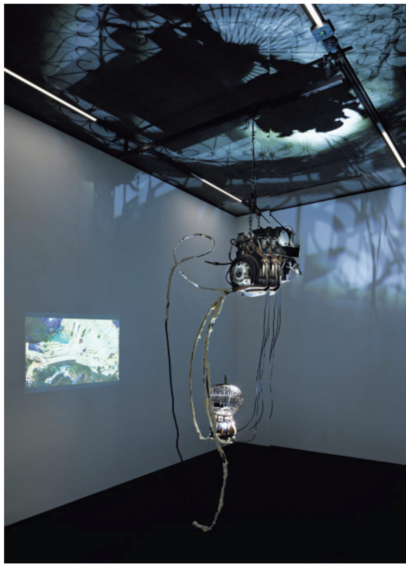
Links: deel van 'A Woman's Sports Car' (2018). Deze installatie heeft een hoog sciencefictiongehalte.

80 | zaterdag 18 maart 2023 | fd persoonlijk