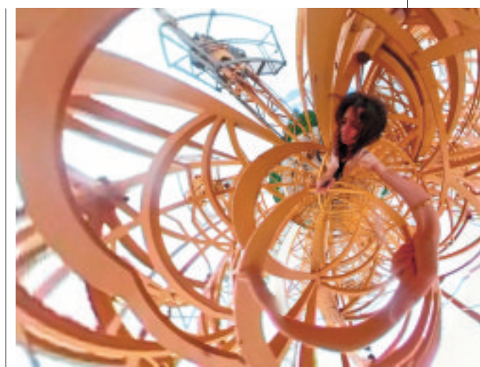
Boven: beeld uit het videowerk 'Rollo', uit 2019. Vogel speelt vaak zelf een rol in haar video's.

78 | zaterdag 18 maart 2023 | fd persoonlijk