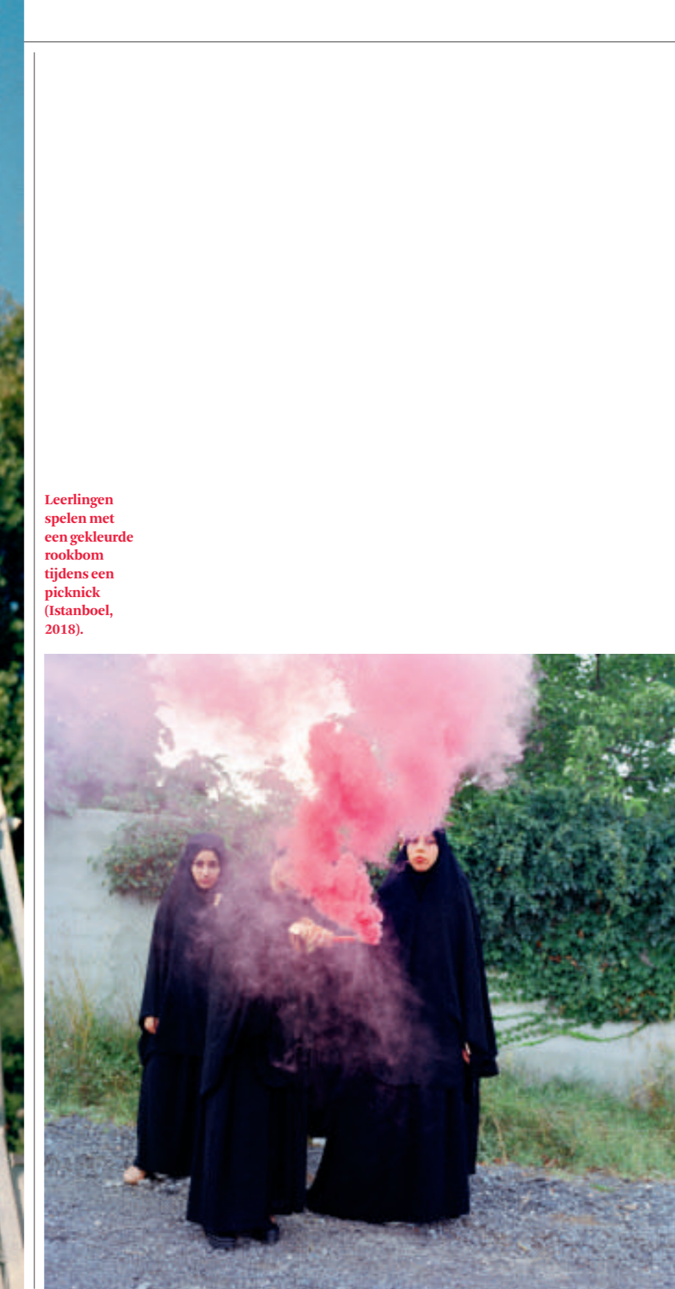
Leerlingen spelen met een gekleurde rookbom tijdens een picknick (Istanbul, 2018).