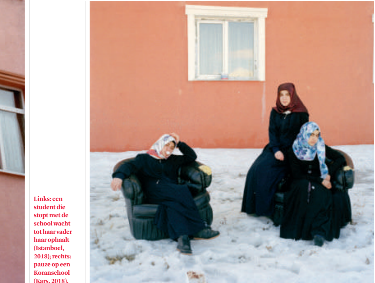
Links: een student die stopt met de school wacht tot haar vader haar ophaalt (Istanbul, 2018); rechts: pauze op een Koranscholen (Kars, 2018).