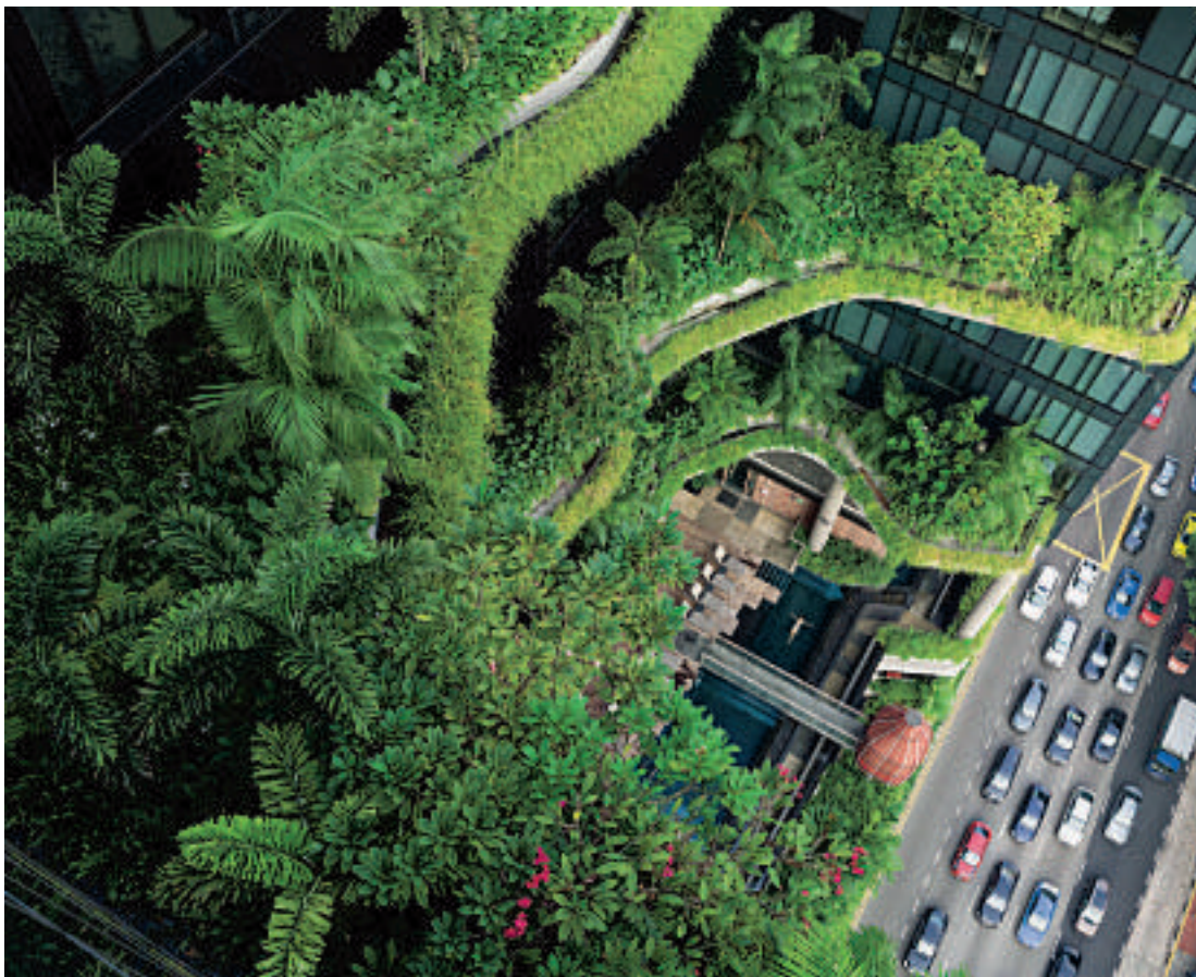
'Esme Swimming', uit 'Human Nature' (2016), van de Amerikaanse fotograaf Lucas Foglia.

Zo toont een foto vanuit de lucht een vrouw liggend in een zwembad van een hotel. Op verschillende niveaus van het hotel bevinden zich grote balkons, die vol staan met exotische planten en die van bovenaf gezien het zwembad lijken te omringen.