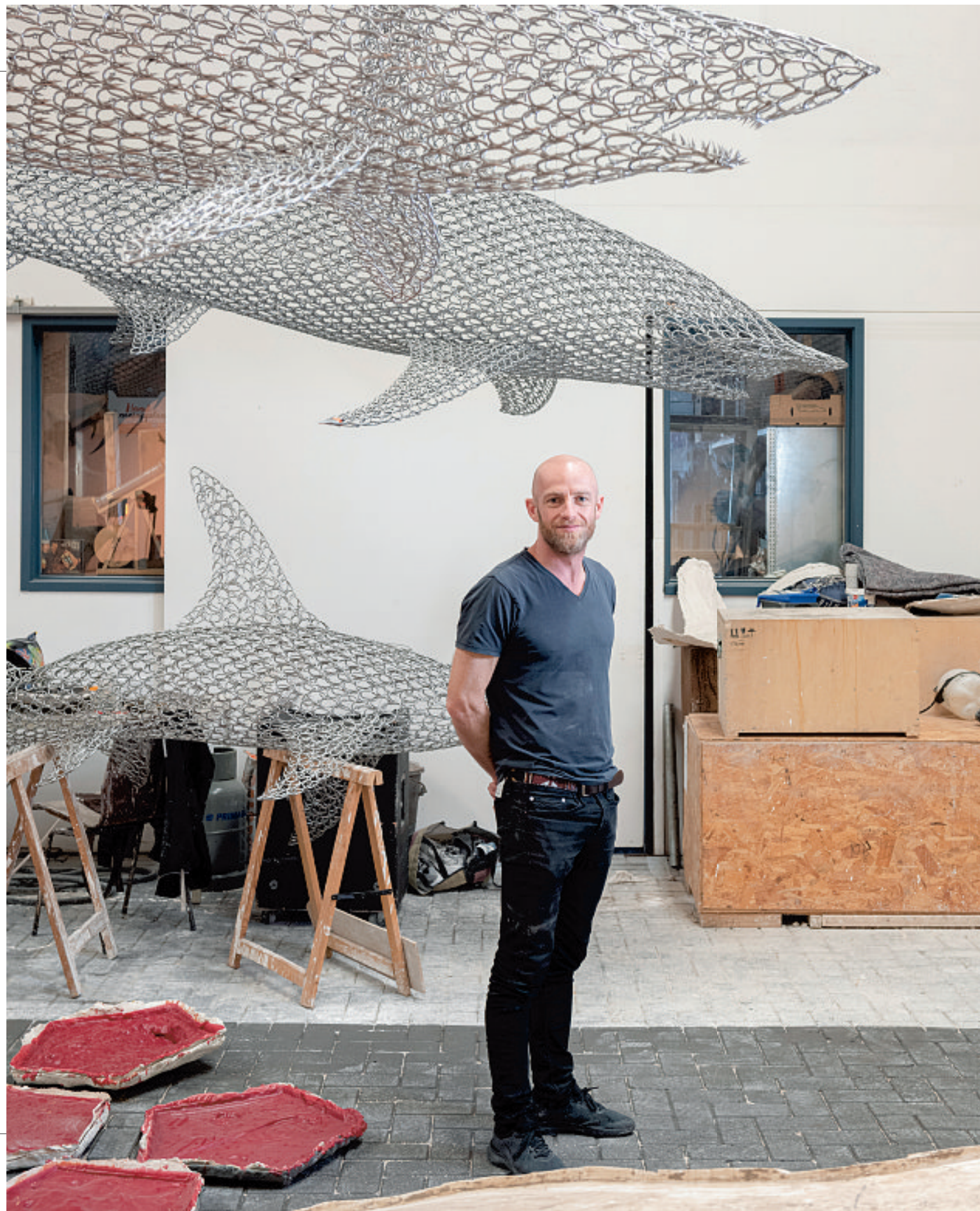
Rechts: Haaien-sculpturen, uit de serie 'Hooked On Life' (2016-2020).