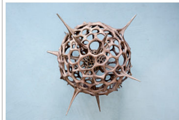
Bronzen plankton-sculptuur uit de serie 'Plankton' (2016-2020).

Na nog een periode duikles te hebben gegeven in Tanzania, besloot hij naar Nederland terug te keren. 'Ik voelde me verwilderd en wilde mijn familie en vrienden weer zien. Daarnaast was ik eind twintig en dacht ik: het wordt tijd om een normale baan te vinden.'